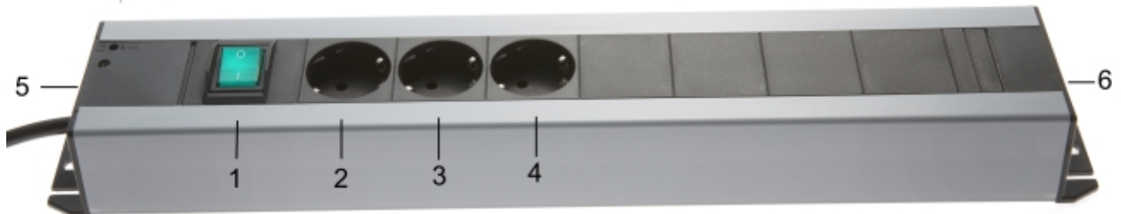
Abbildung 1: Steckdosenleiste