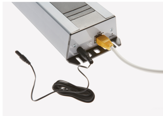
Abbildung 3: Kopfseite mit Anschlüssen